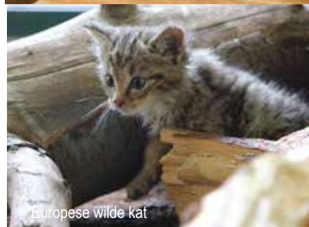
Europese wilde kat