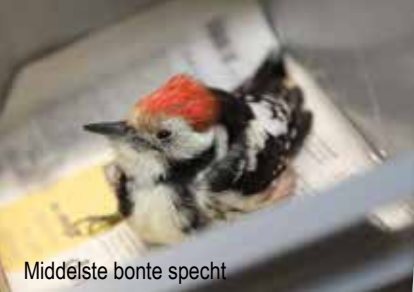
Middelste bonte specht